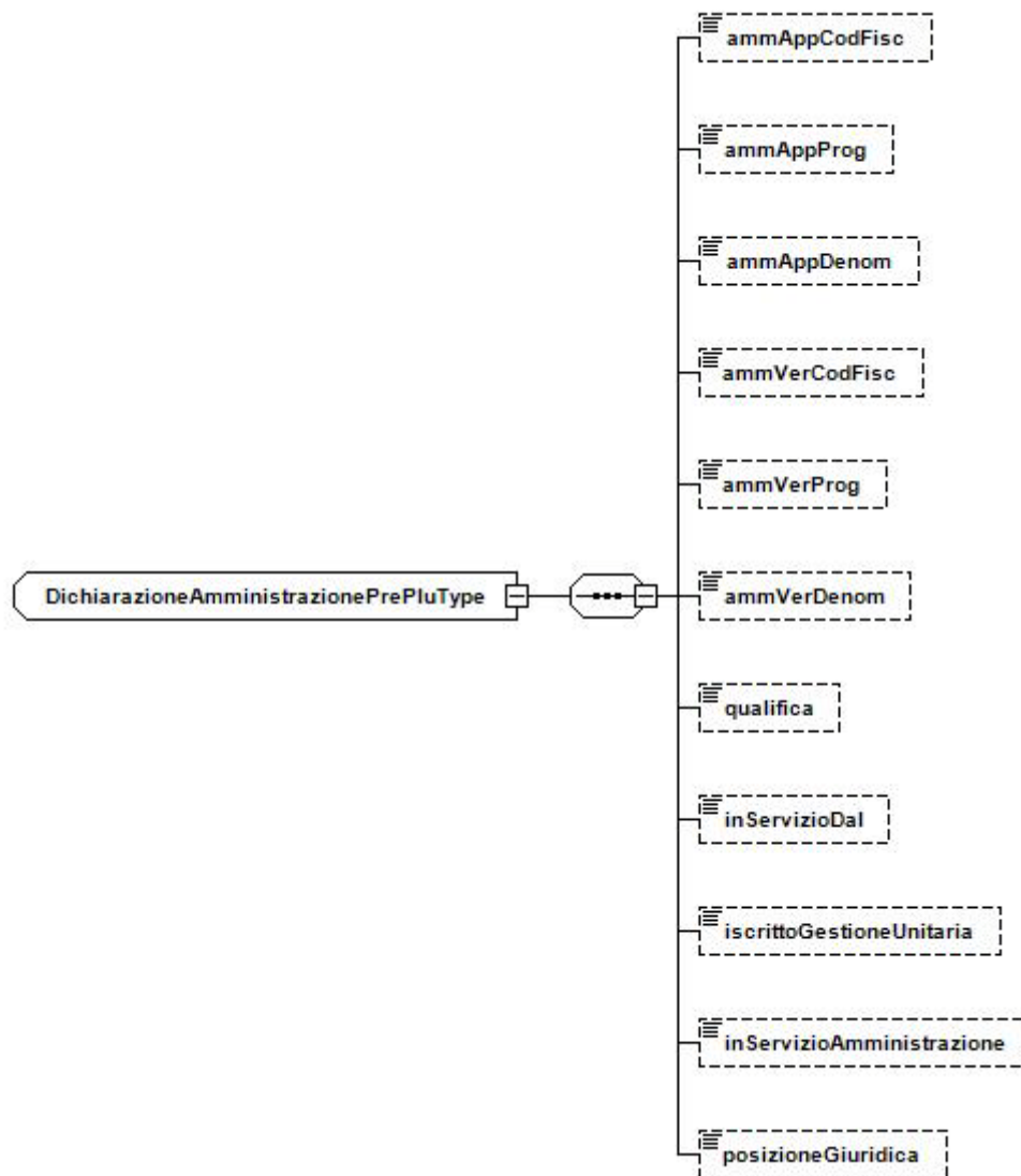
Figura 3 – Dichiarazione Amministrazione