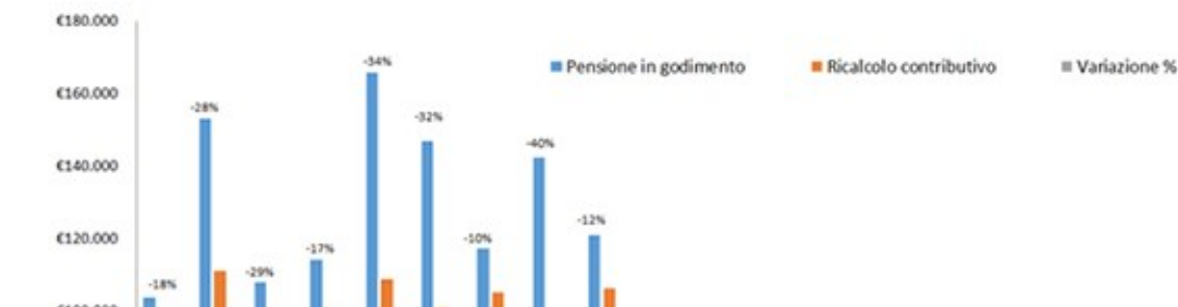
Confronto calcolo retributivo/contributivo Importi lordi annuali

Qui di seguito si riportano alcuni casi che documentano come le pensioni di vecchiaia e anzianità del personale della carriera diplomatica si rapportano con le prestazioni che sarebbero state erogate applicando il metodo contributivo 8 . Sebbene il campione sia ridotto si nota una riduzione media dell'ordine del 29% sulla pensione lorda.