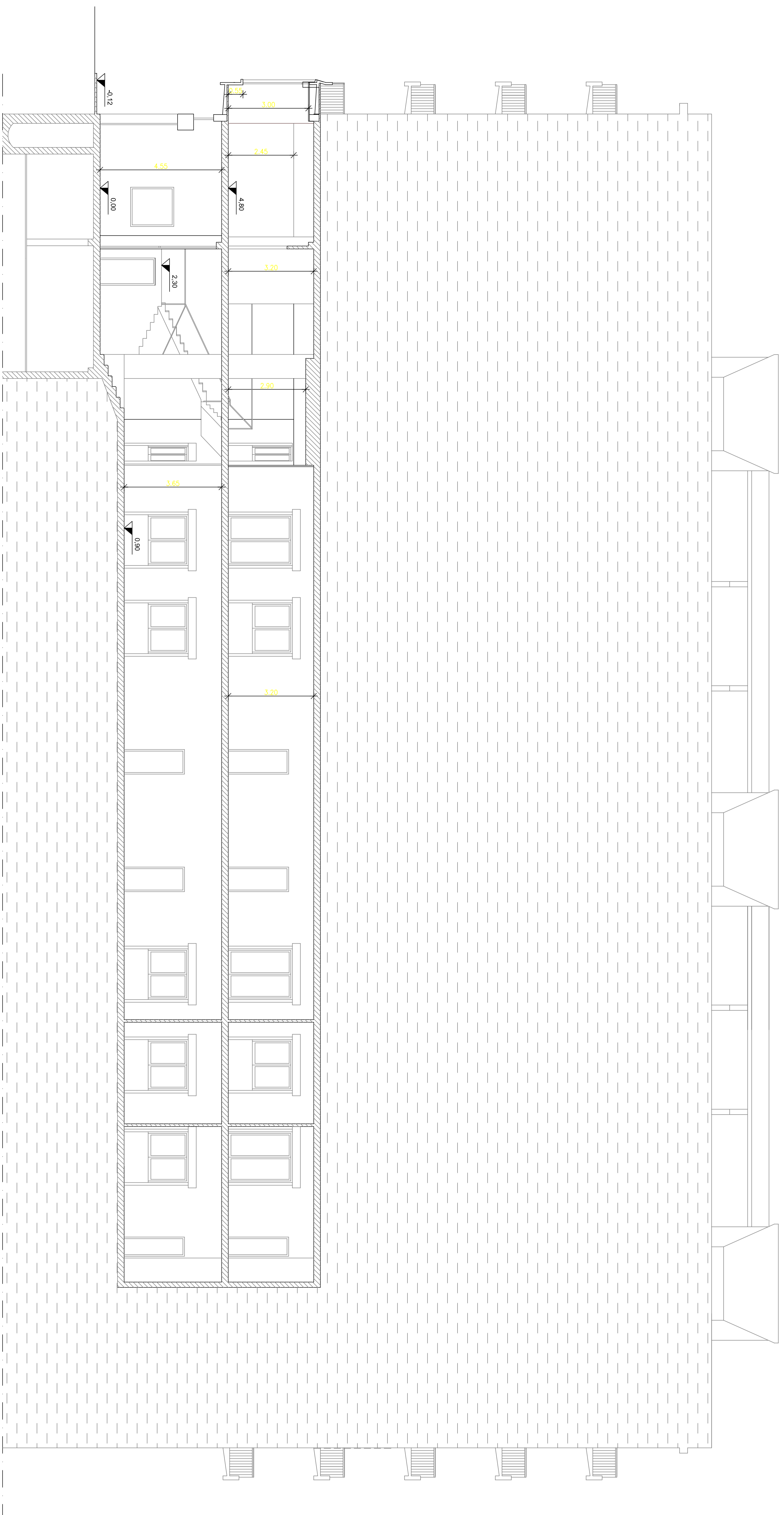
SEZIONE L-L STATO DI FATTO

INPS DIREZIONE REGIONALE PER LA LOMBARDIA