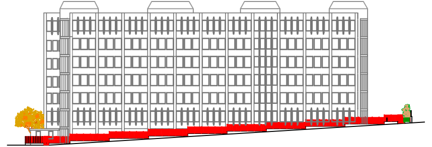
PROSPETTO VIA MARTIRI D'UNGHERIA STATO ATTUALE