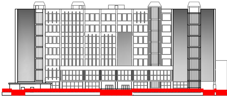
PROSPETTO VIA MICHELE FOSCHINI STATO ATTUALE