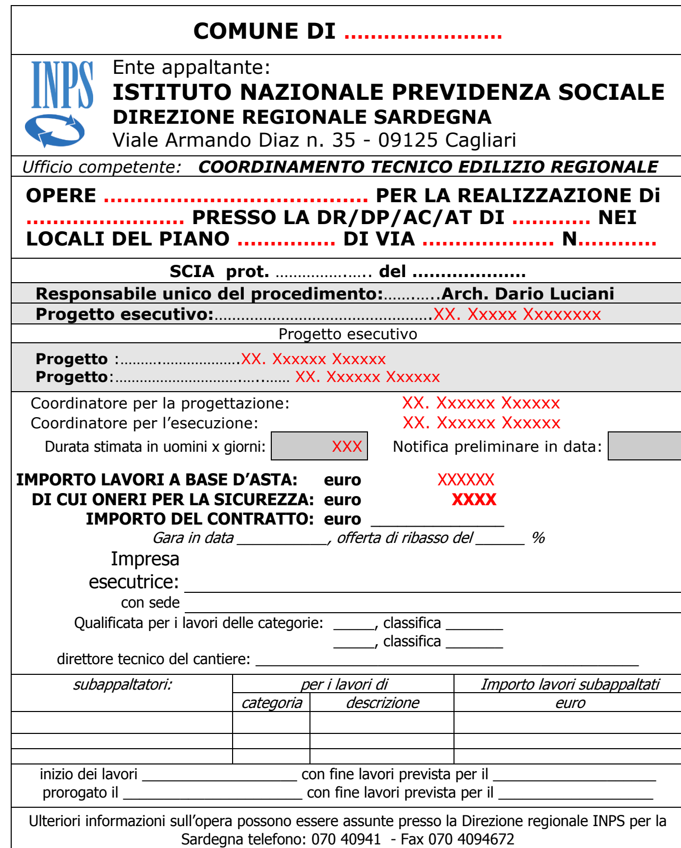
TABELLA «A» CARTELLO DI CANTIERE