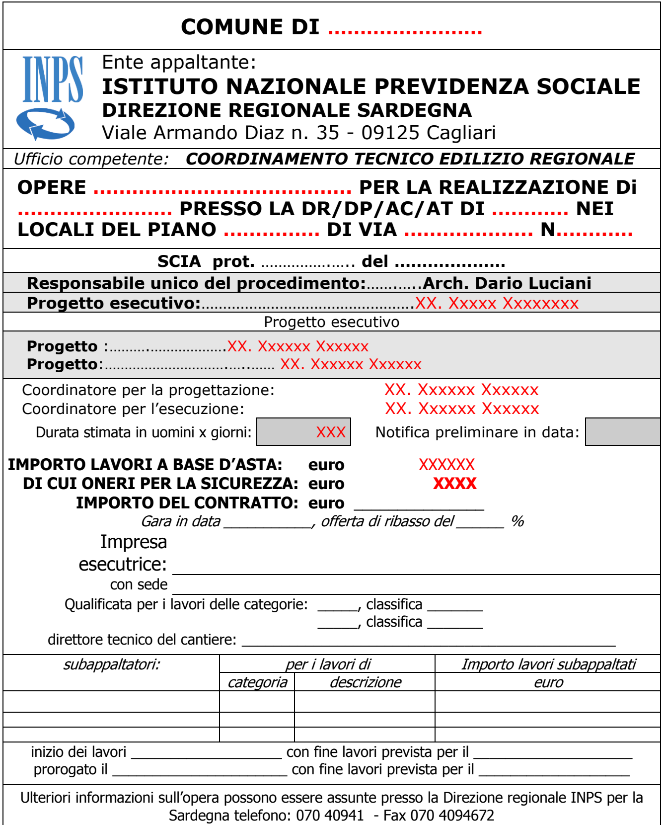
TABELLA «A» CARTELLO DI CANTIERE