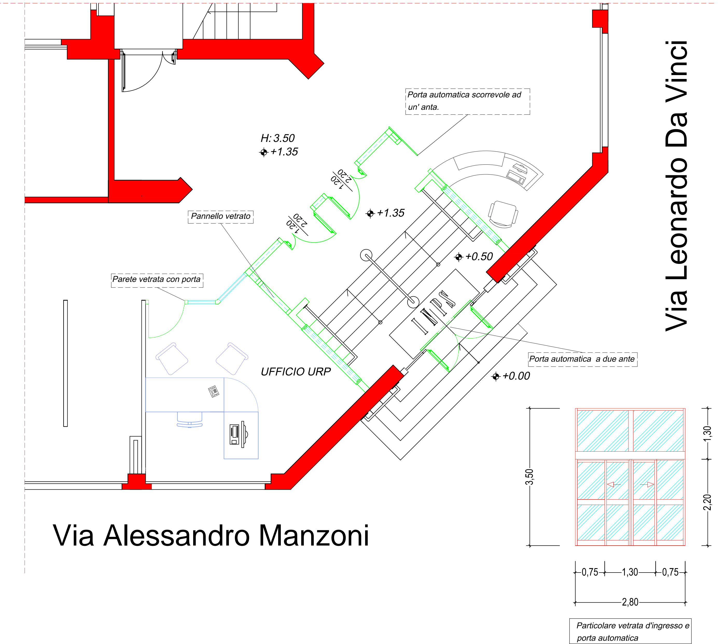
Via Alessandro Manzoni