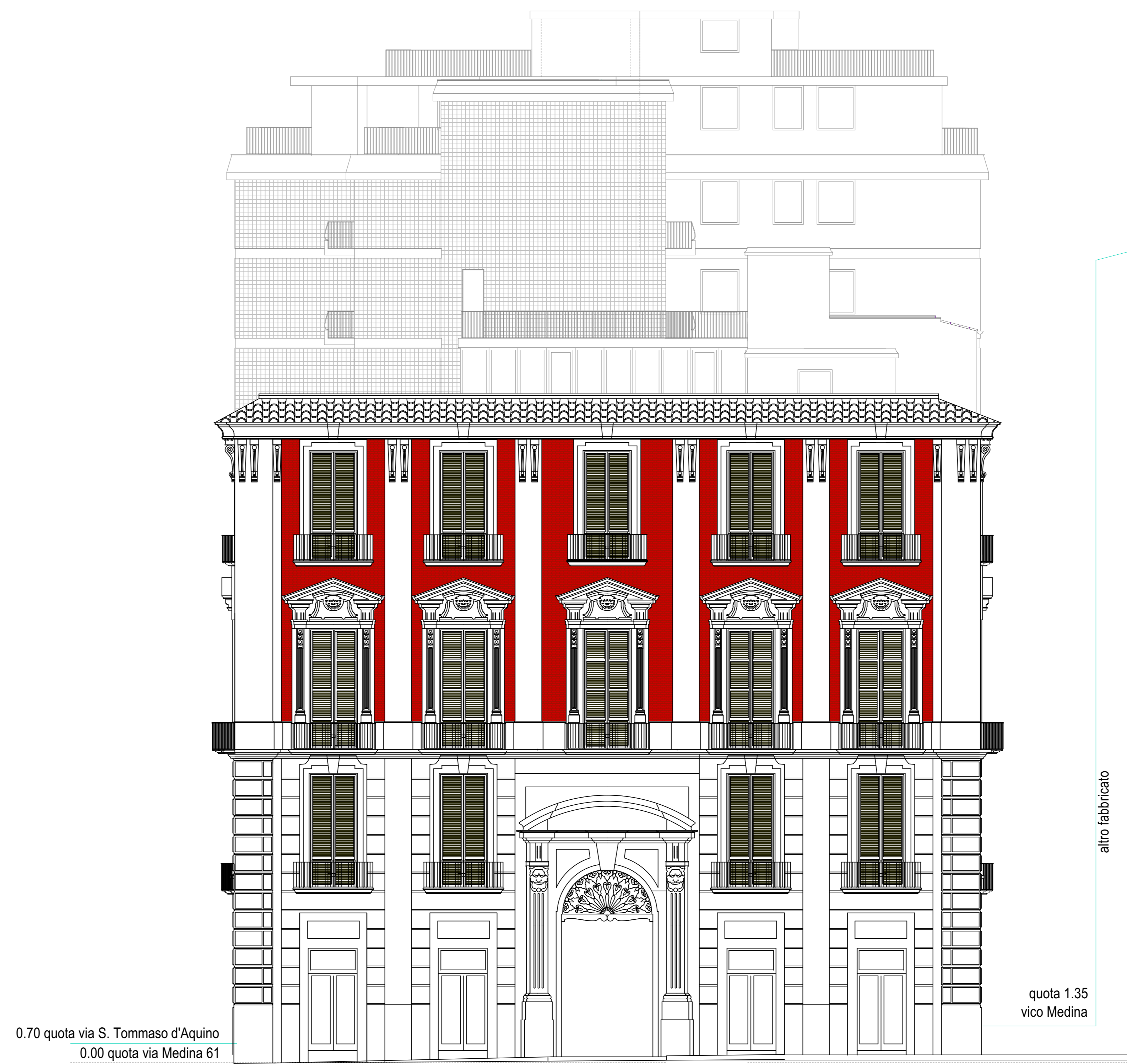
prospetto su via medina scala 1:100