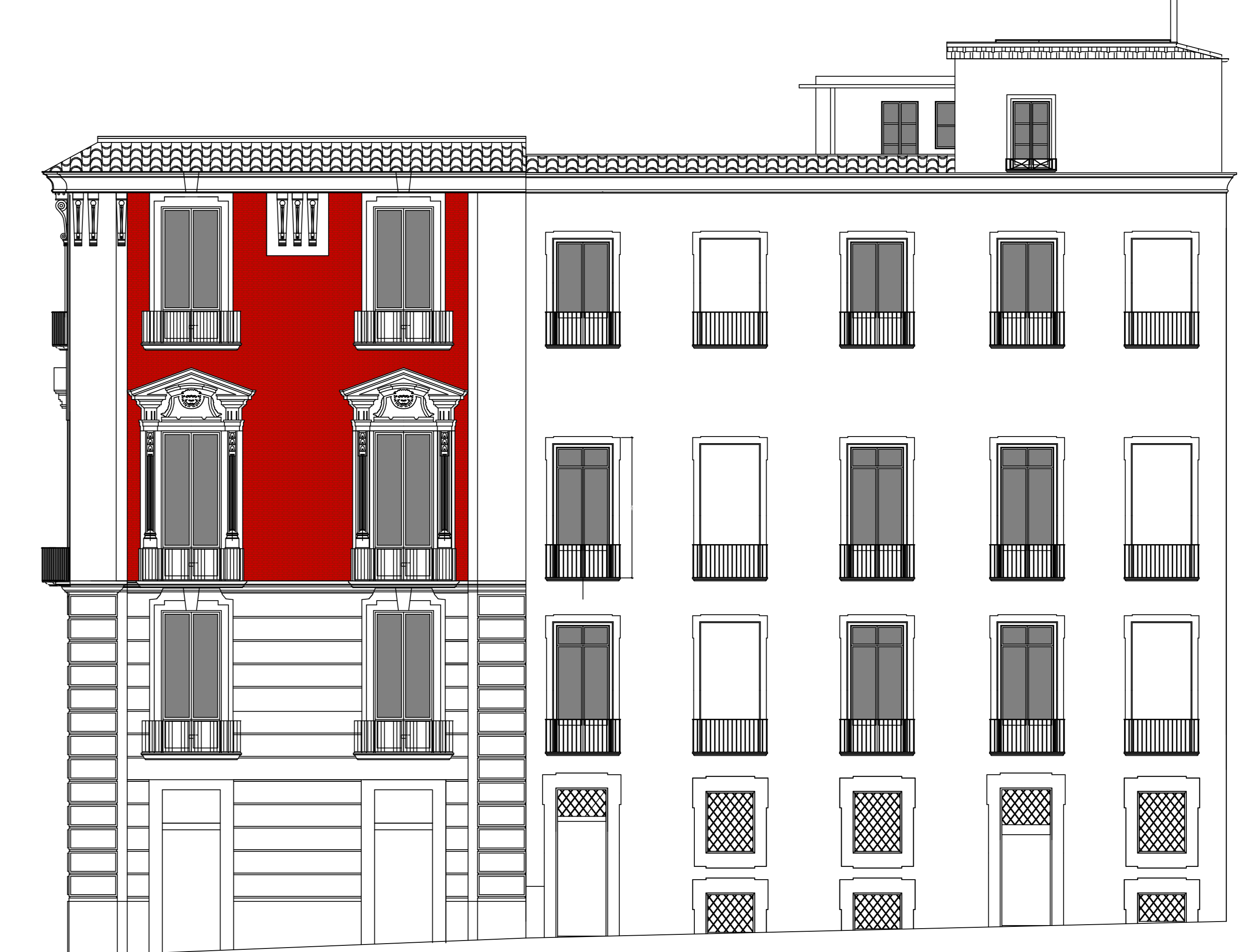
prospetto su vico medina scala 1:100 (analogo su via San Tommaso D'Aquino)