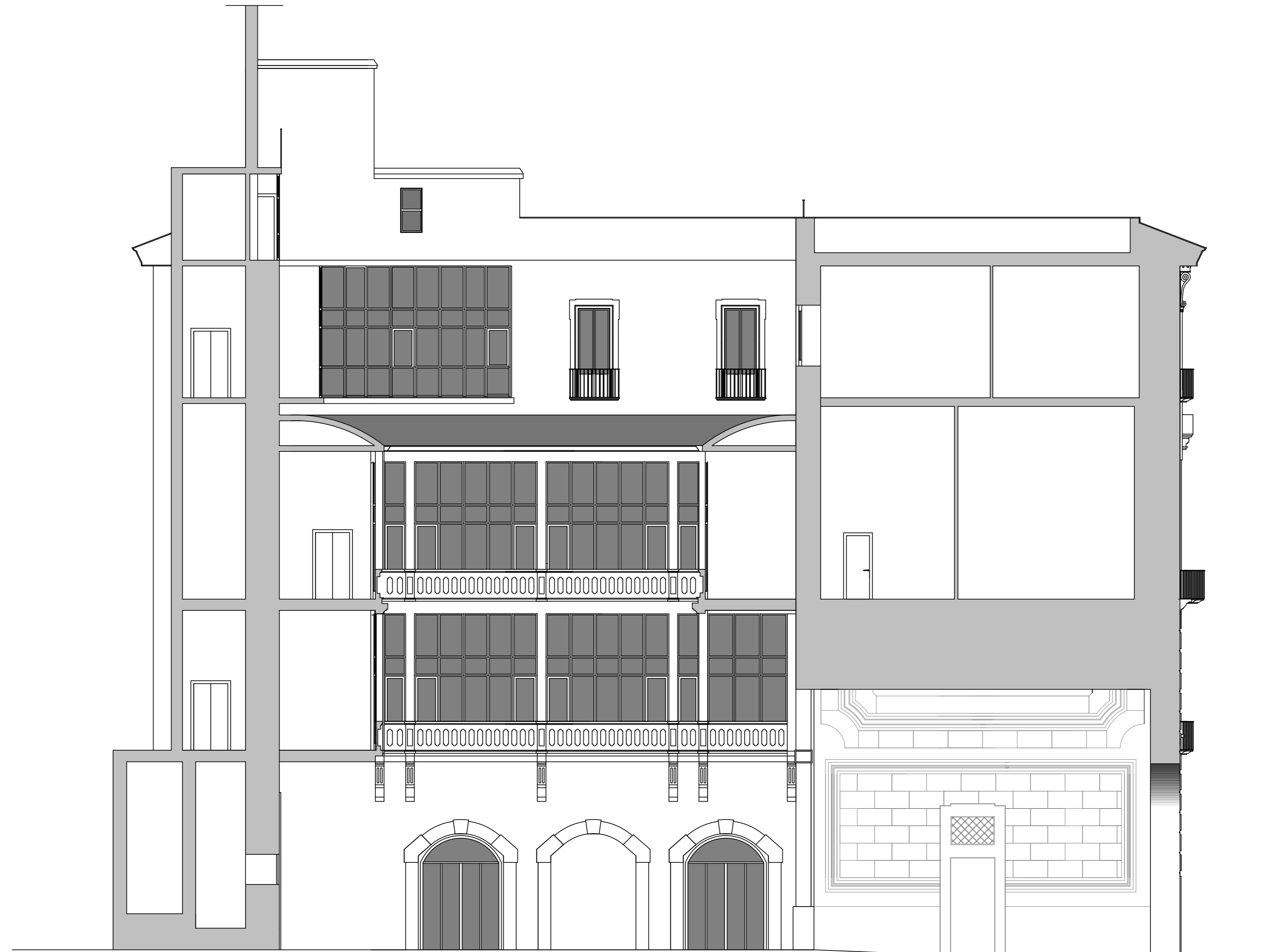
prospetto -sezione interna longitudinale dx e sx scala 1:100