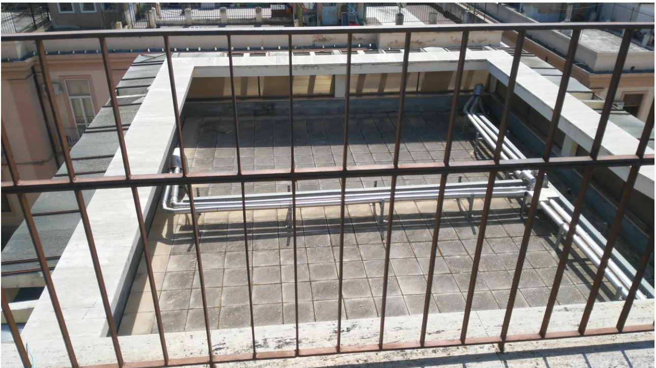
COPERTURA 3° PIANO ANGOLO SU UFFICI COMUNALI- VIA DEL TORRIONE- CORTILE