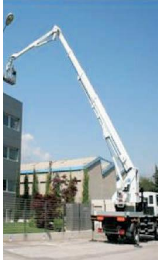
Piattaforma di lavoro mobile autocarrata