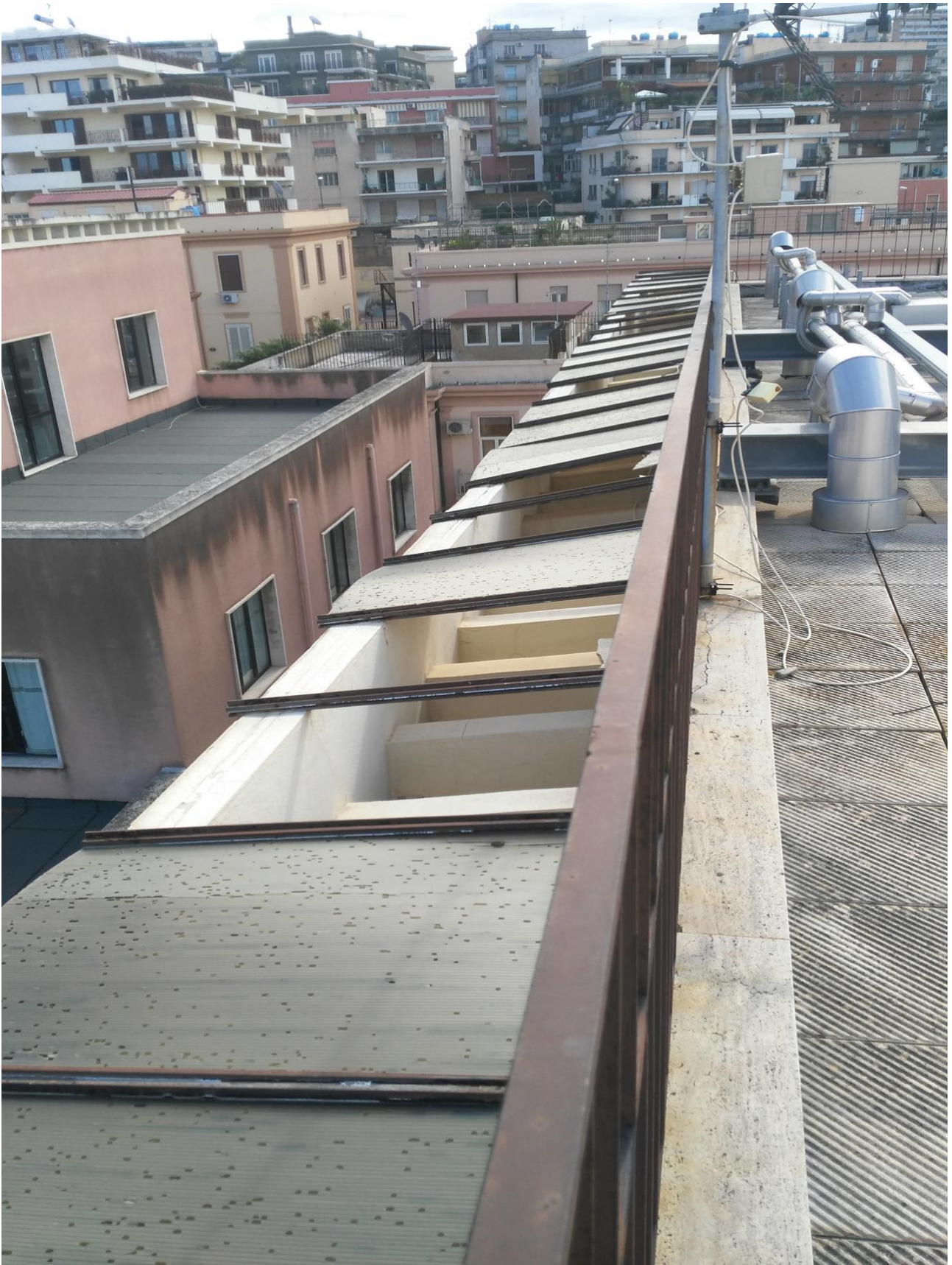
PANNELLI E TELAIO LATO UFFICI COMUNALI