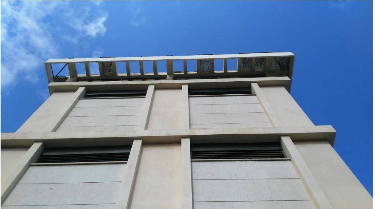
PROSPETTO SU VIA DEL TORRIONE