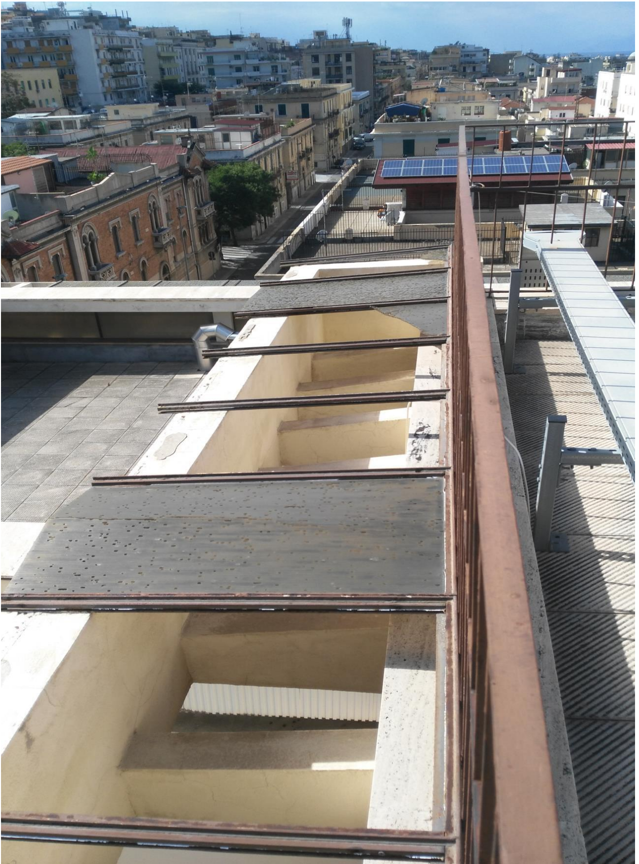
COPERTURA 4° PIANO AFFACCIO CORTILE INTERNO VIA DEL TORRIONE