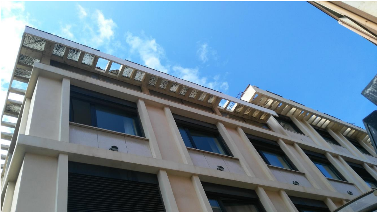
PROSPETTO SU UFFICI COMUNALI