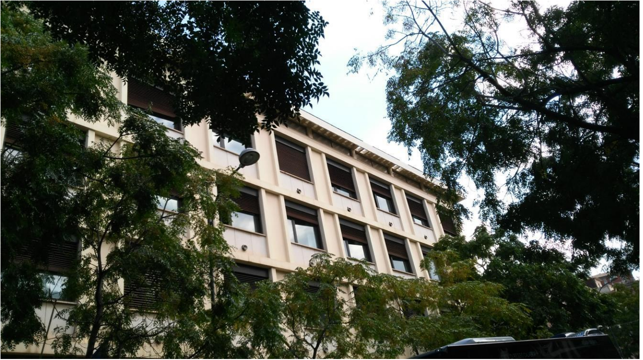
PROSPETTO SU VIA D. ROMEO