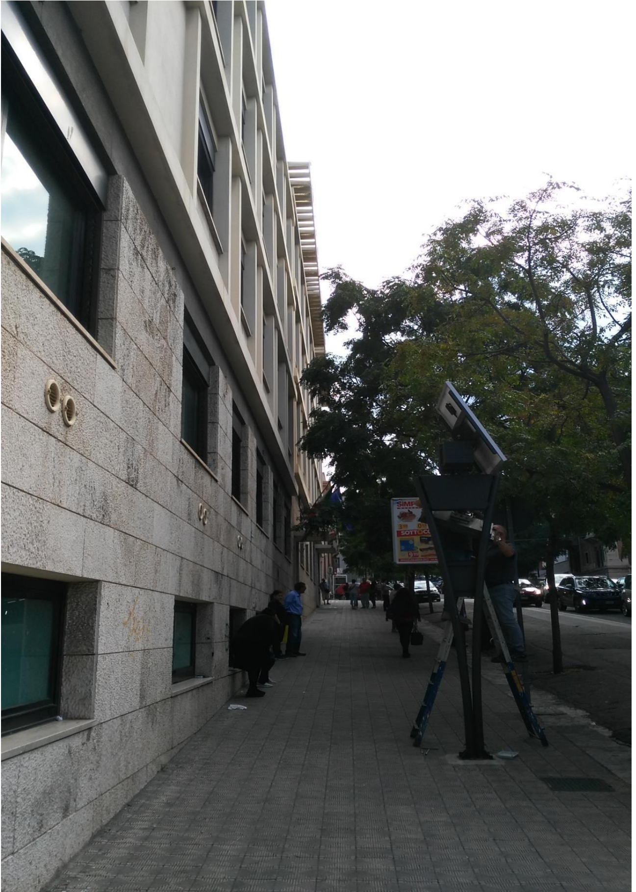
PROSPETTO SU VIA D. ROMEO