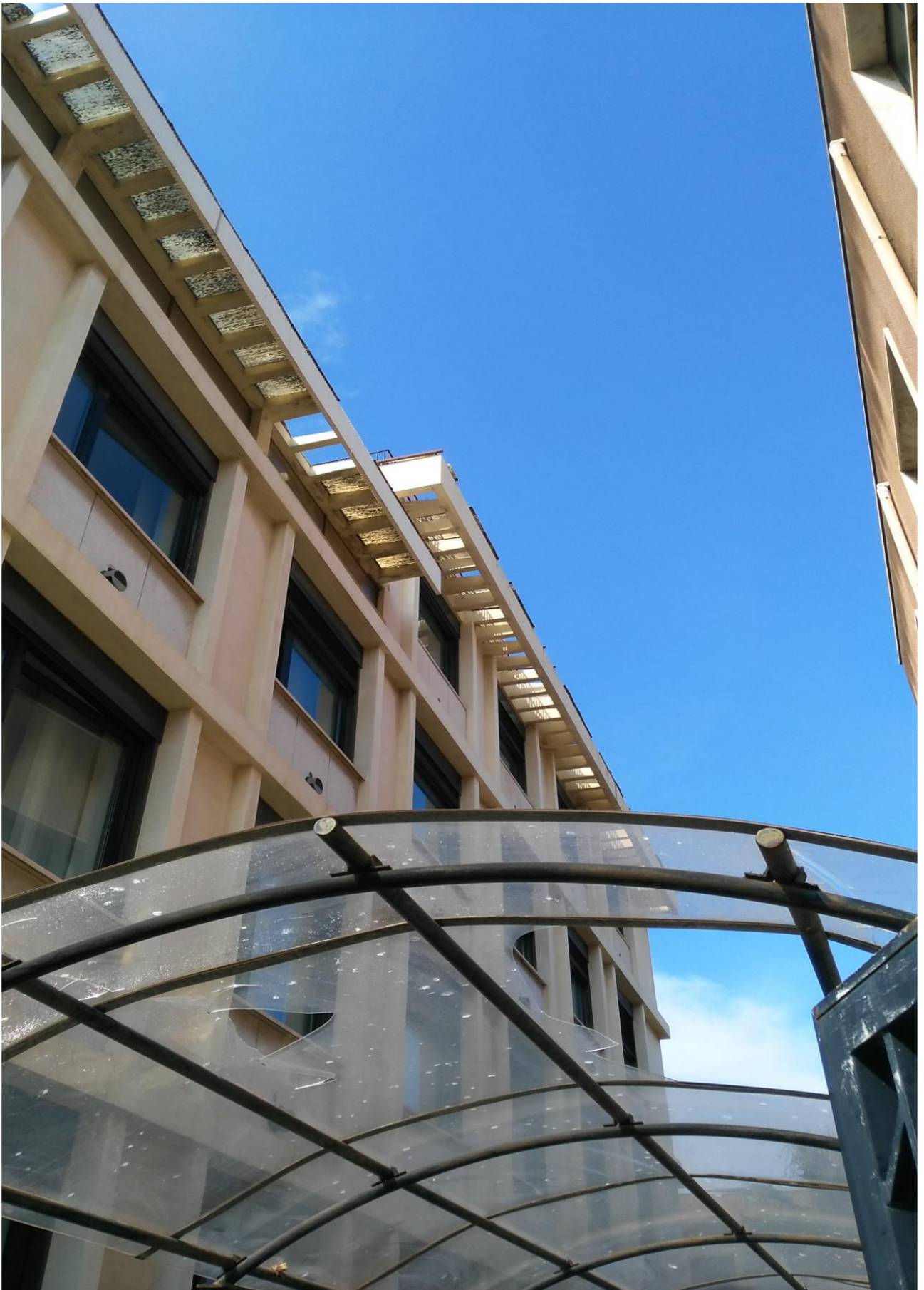
PROSPETTO SU UFFICI COMUNALI