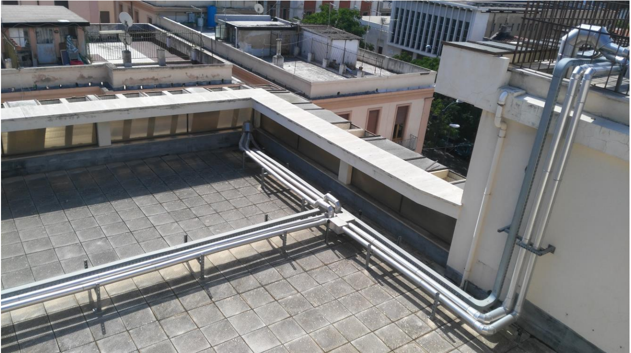
COPERTURA 3° PIANO ANGOLO VIA DEL TORRIONE-CORTILE