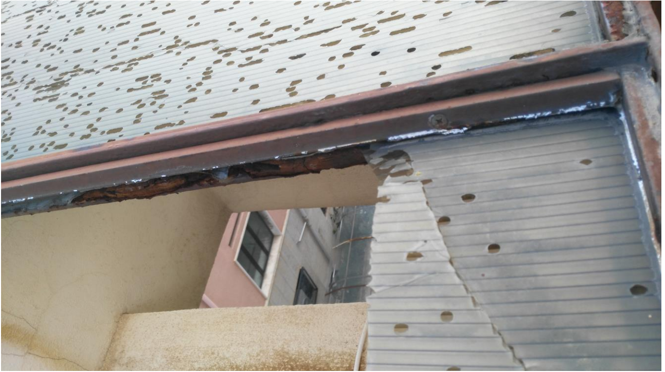
PARTICOLARE TELAIO IN FERRO- PANNELLI IN POLICARBONATO ALVEOLARE