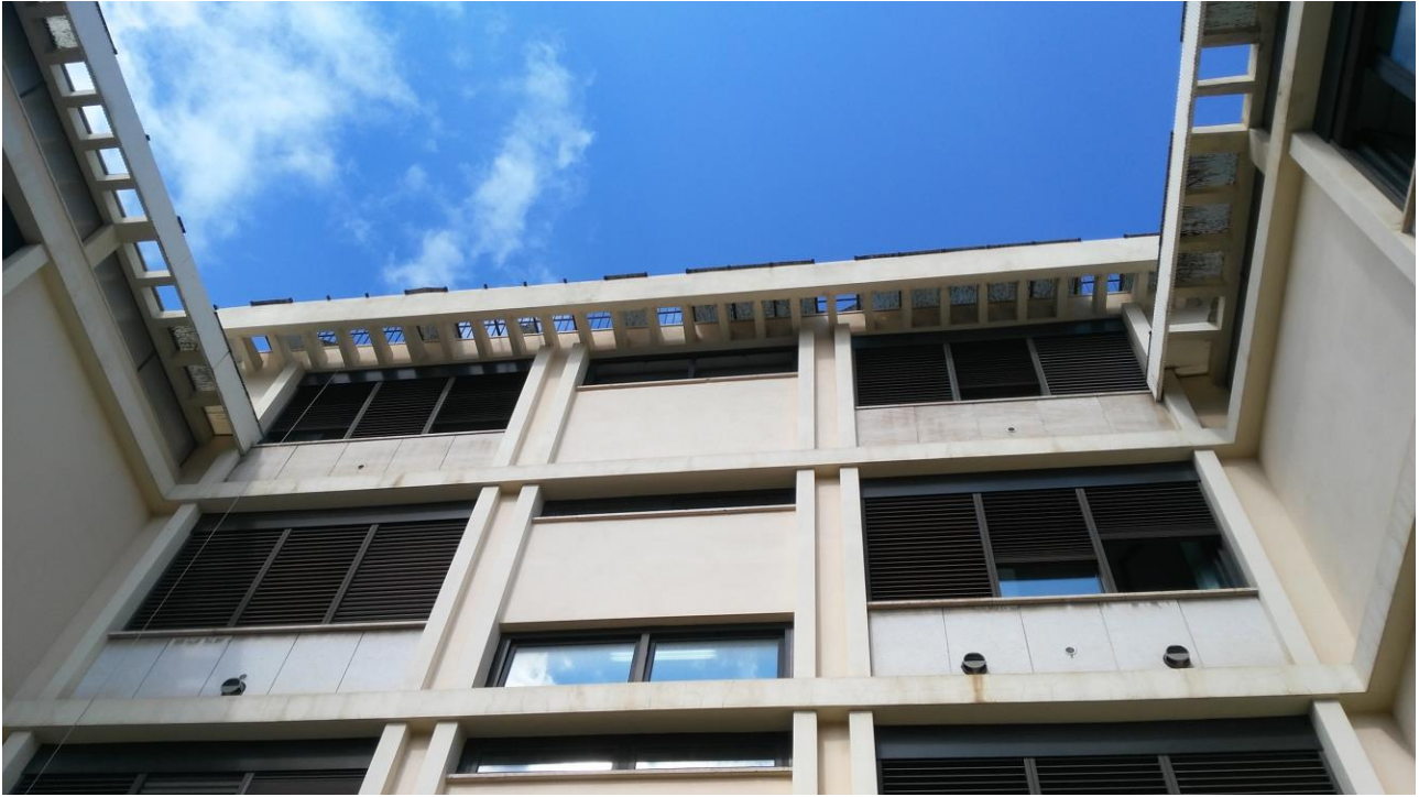
PROSPETTO SU CORTILE LATO VIA DEL TORRIONE