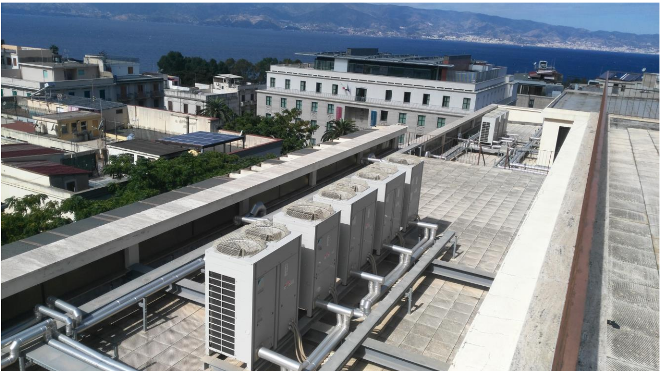
COPERTURA 3° PIANO LATO VIA D. ROMEO