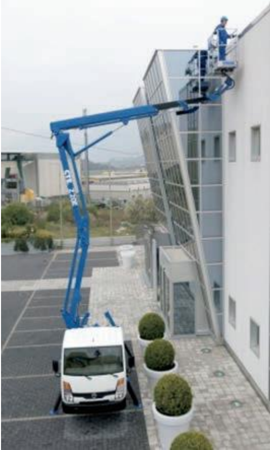
Piattaforma di lavoro mobile elevabile autocarrata