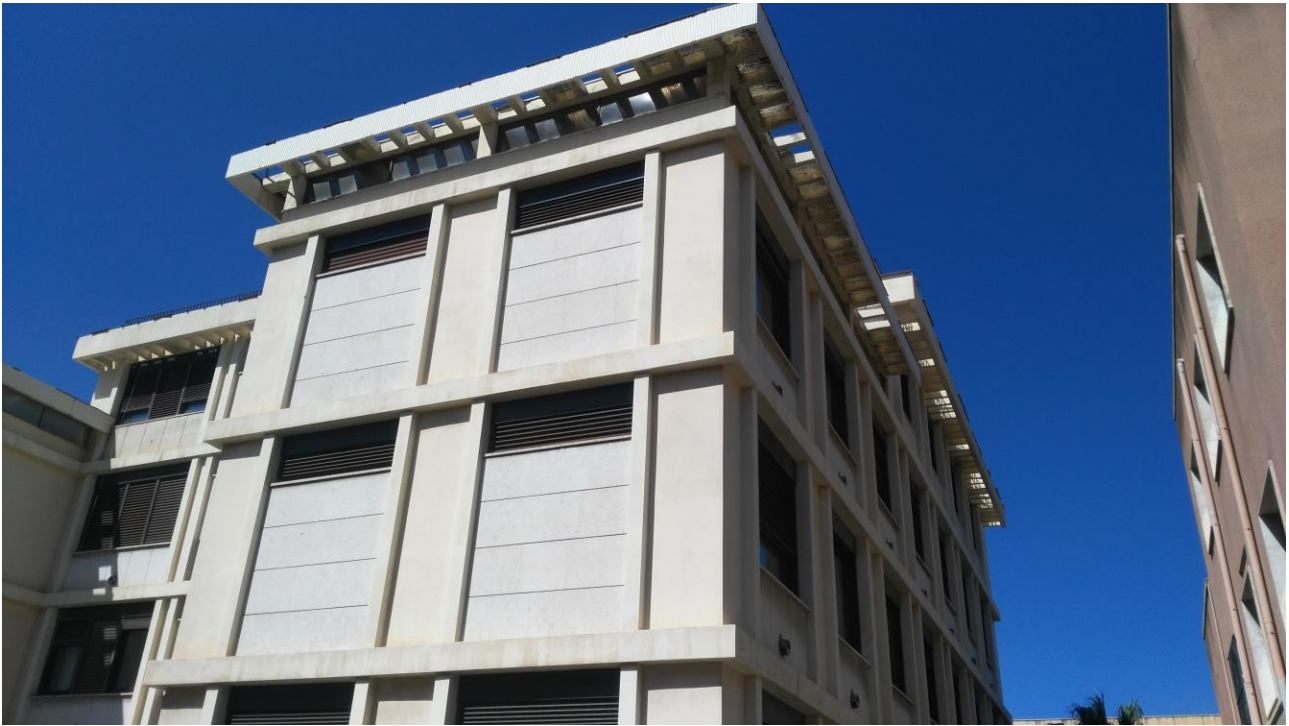
PROSPETTO ANGOLO VIA DEL TORRIERE-UFFICI COMUNALI