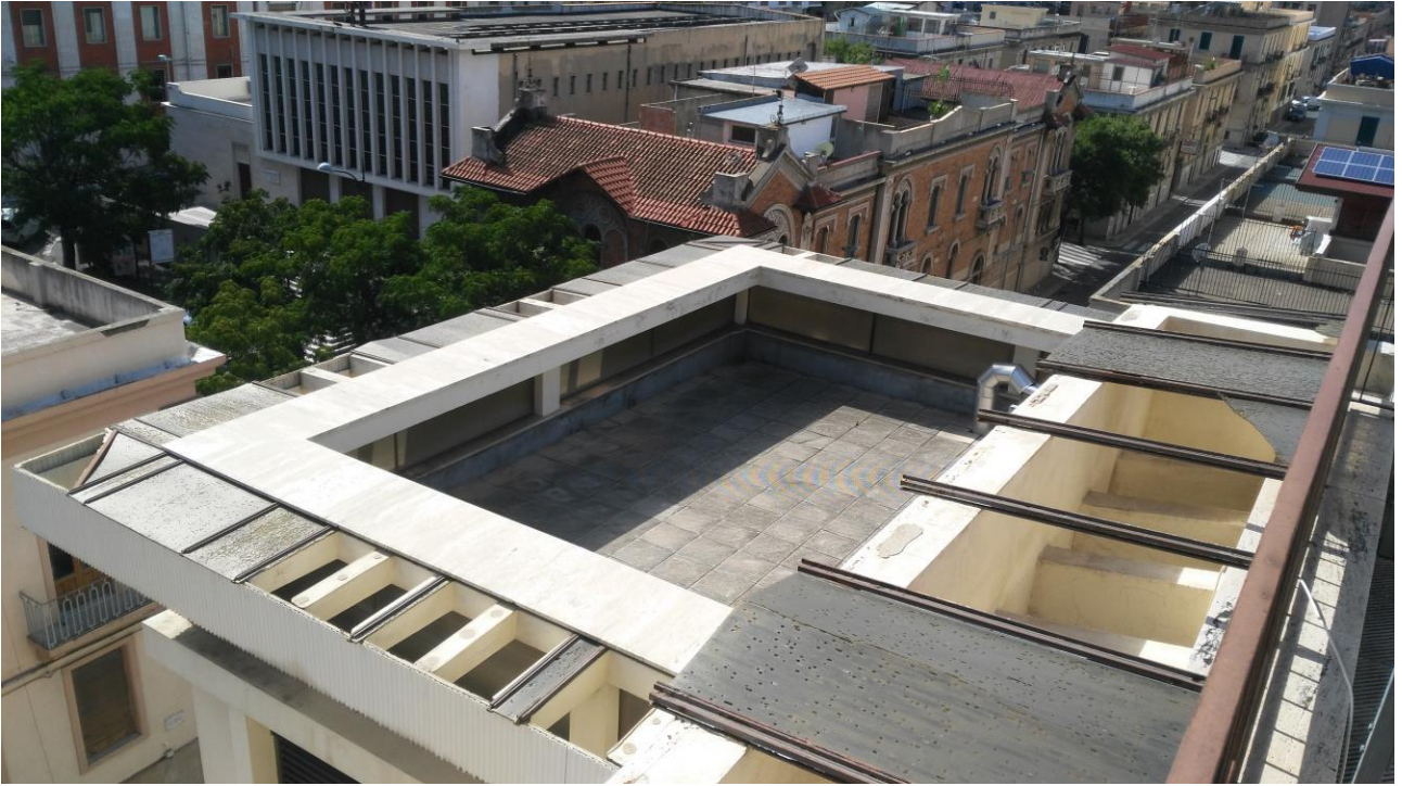
COPERTURA 3° PIANO ANGOLO VIA DEL TORRIONE – VIA D. ROMEO