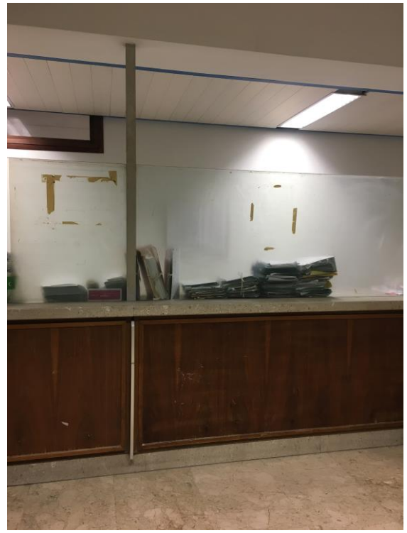
Particolari area vecchia zona pubblico