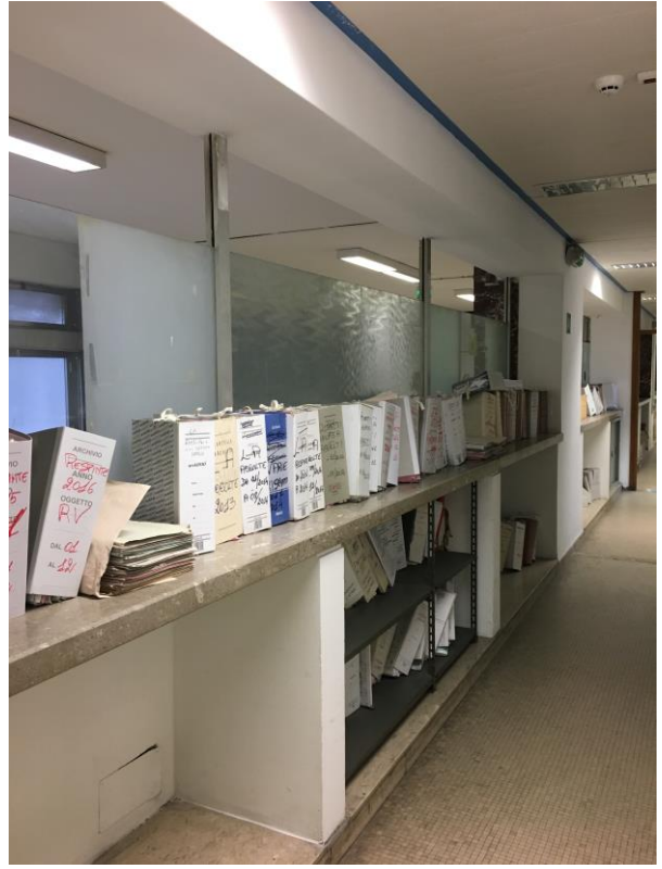
Particolari uffici e corridoi