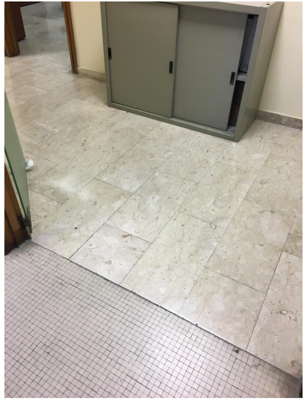
Particolari uffici e corridoi