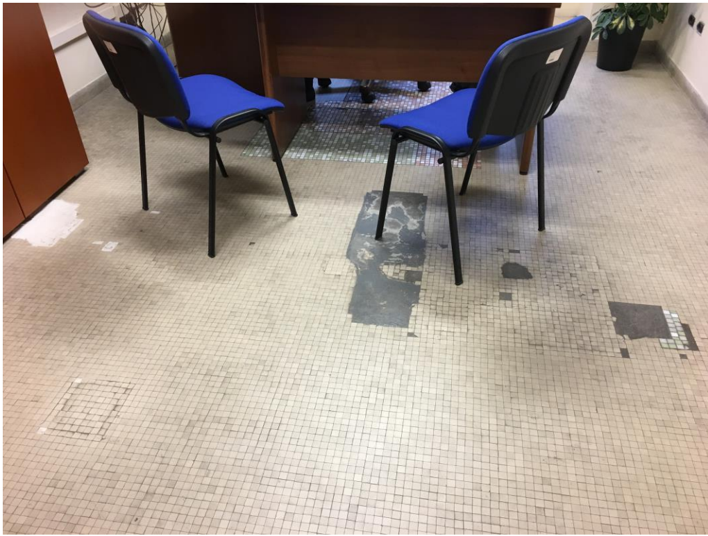
Particolari uffici e corridoi