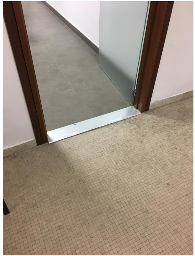
Particolari uffici e corridoi