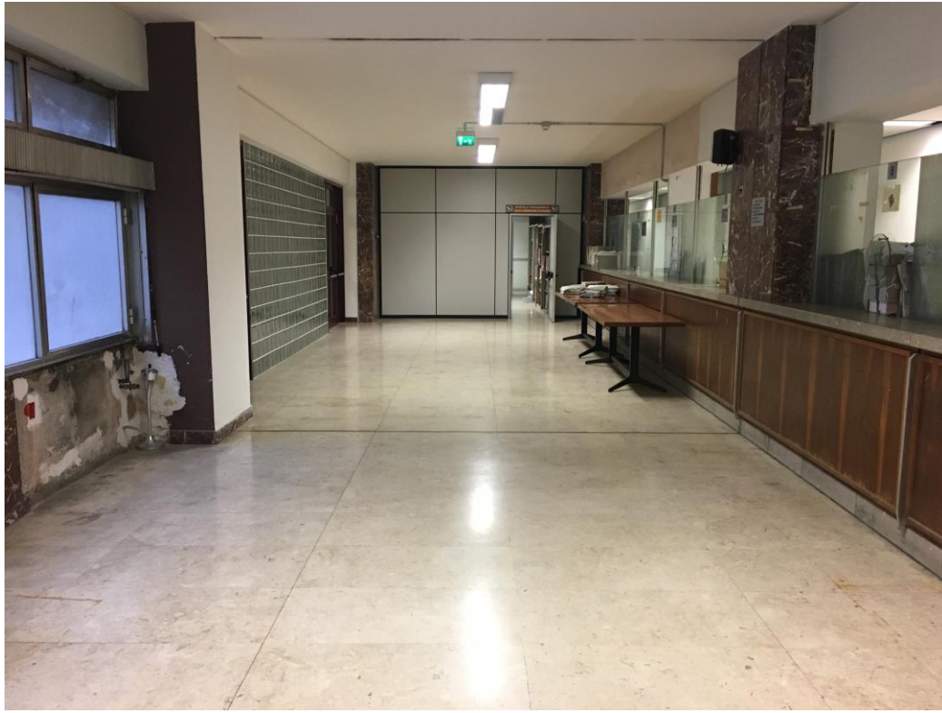
Particolari area vecchia zona pubblico