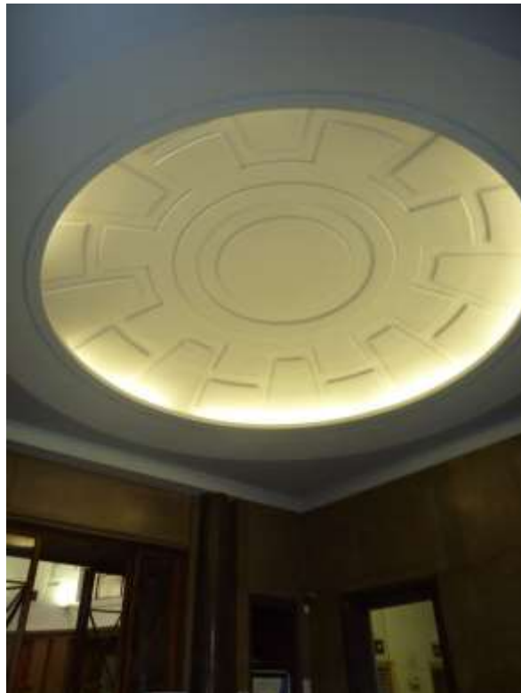
INPS - Coordinamento tecnico regionale Lombardia Milano, Via Gonzaga n.6