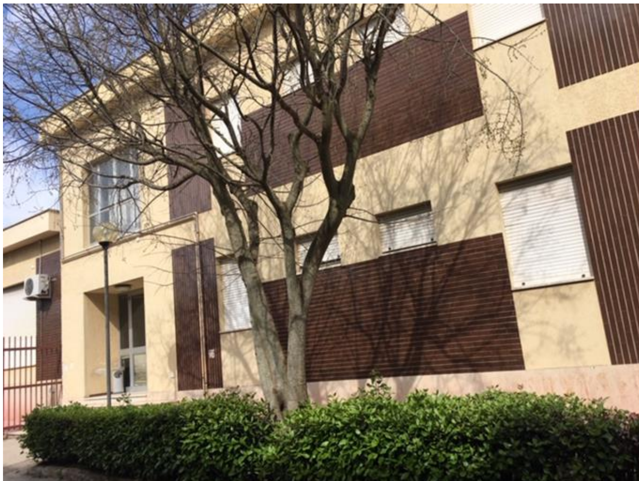
Tavola 8 –RILIEVO FOTOGRAFICO

OGGETTO: Convitto "Luigi Sturzo" Via delle Industrie 9 Caltagirone. Lavori di manutenzione straordinaria Palazzina