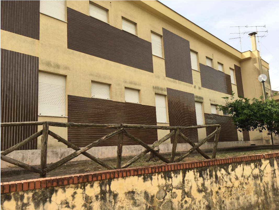
FOTO N.3 - PROSPETTI ESTERNI