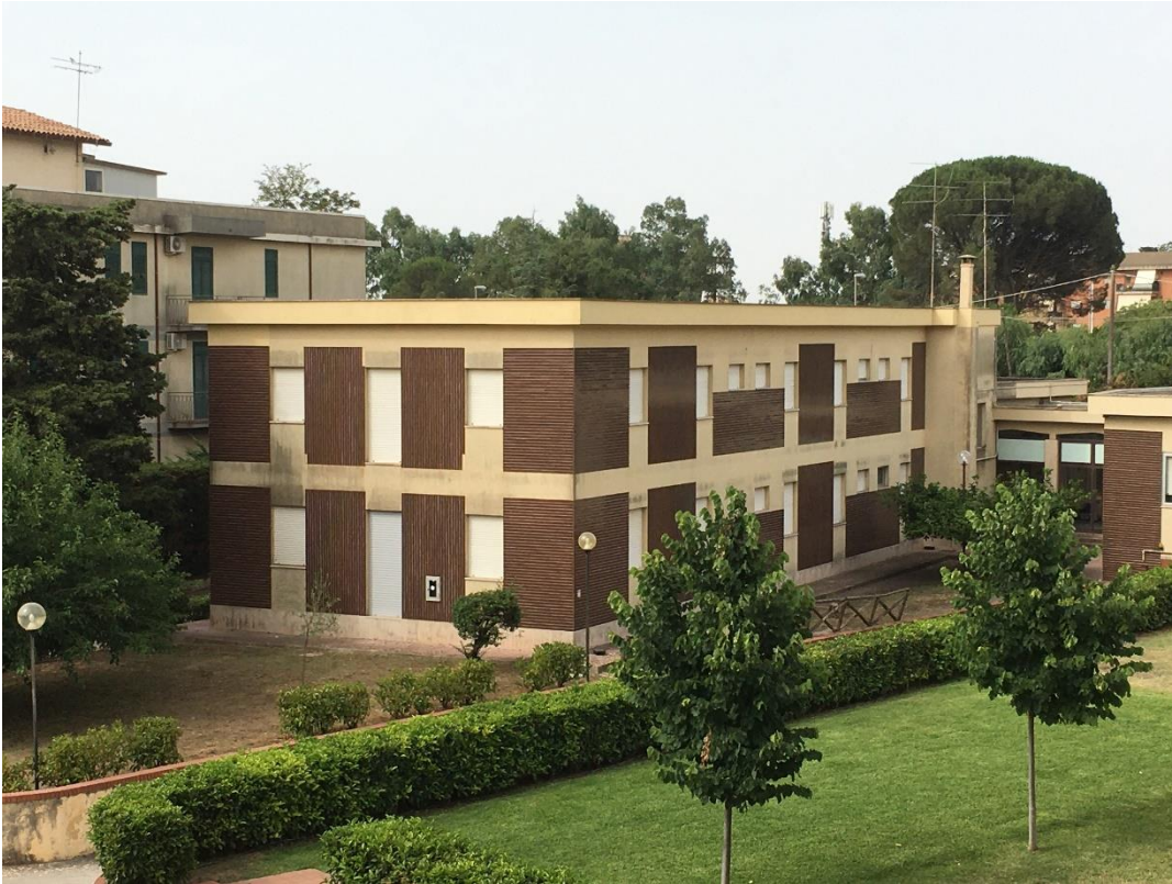
FOTO N.1 - PROSPETTI ESTERNI