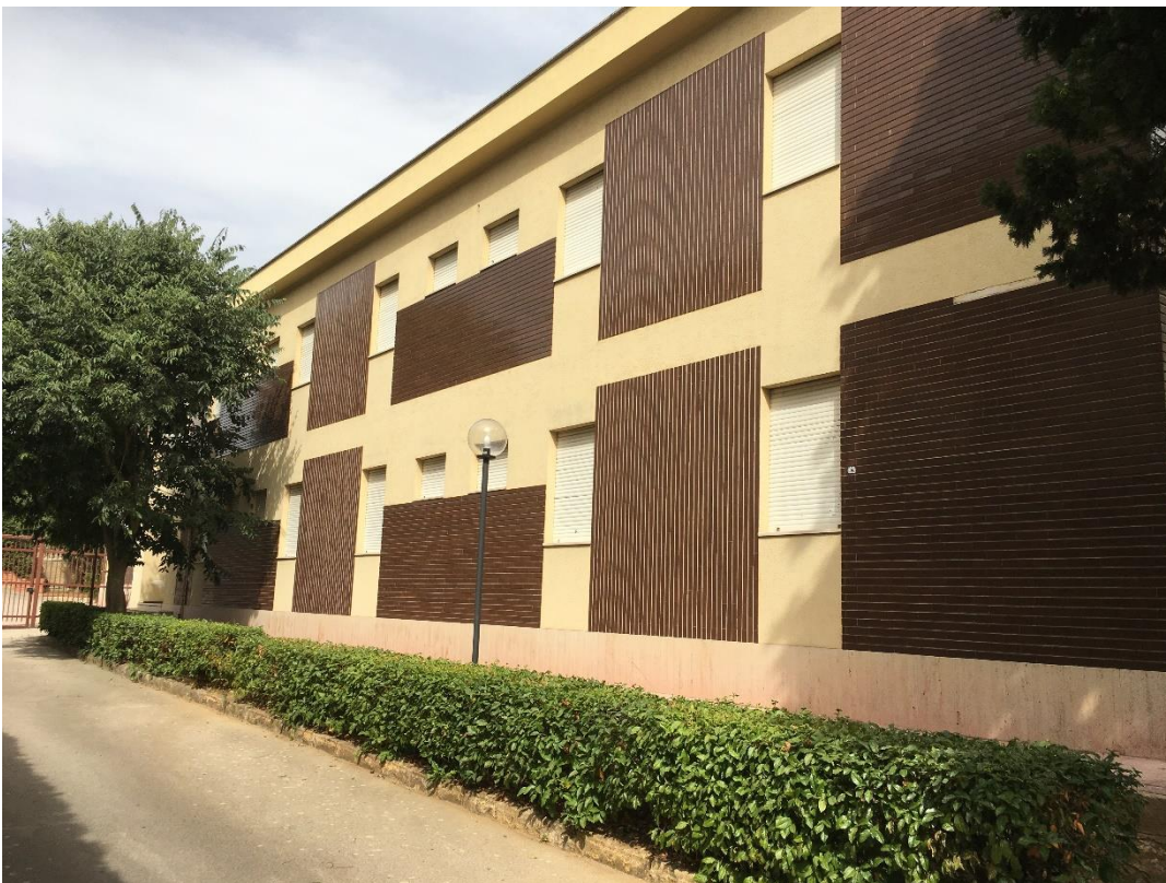
FOTO N.4 - PROSPETTI ESTERNI