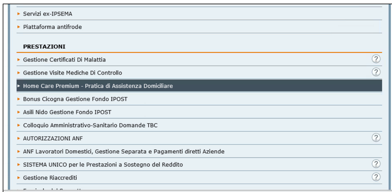
Figura 2: Elenco Prestazioni