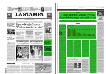
Superficie 64 %

Inoltre, in questi settori, si potrebbe avere uno choc positivo