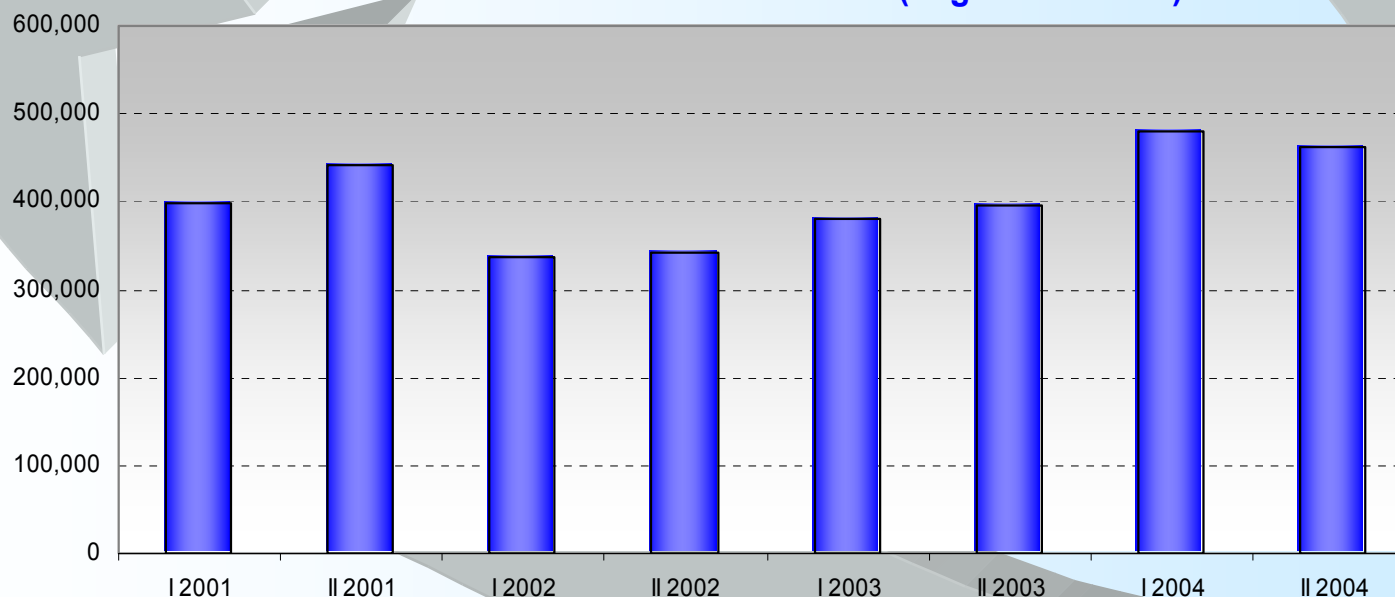
Incassi dei Concessionari per semestre relativamente al periodo 1 Gennaio 2001 - 11 Gennaio 2005 (migliaia di Euro)