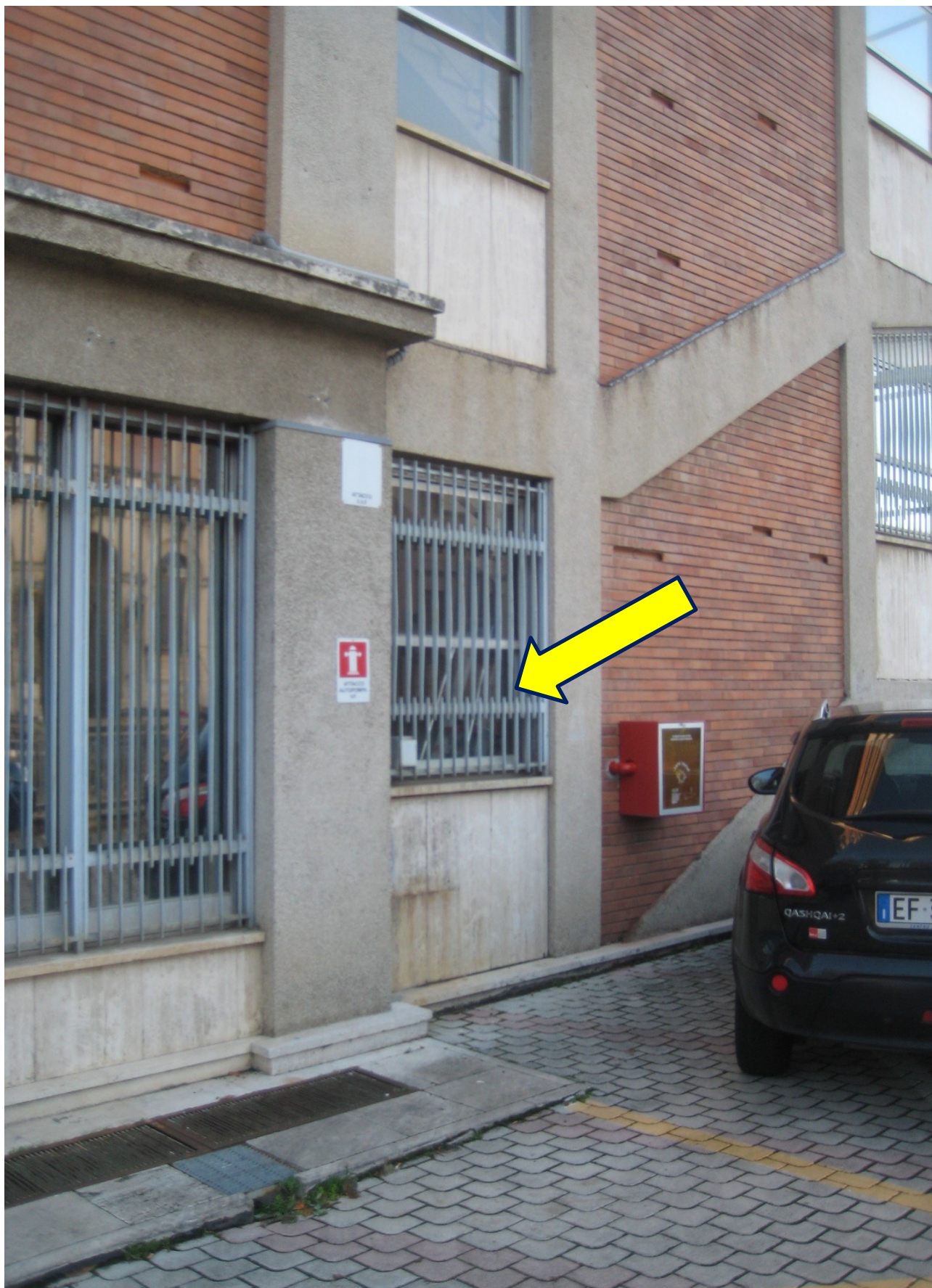
REALIZZAZIONE DI USCITA DI EMERGENZA AL PIANO TERRA DELLA SCALA "A" ( a servizio per il pubblico) ,IN LUOGO DELL'ESISTENTE VANO FINESTRA, DI TIPO A DUE ANTE CON SOPRALUCE FISSO E GRATA IN FERRO .